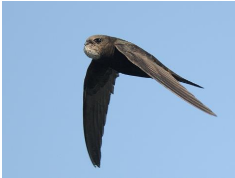
Un Vencejo trae comida para sus pollos, su buche atiborrado de insectos que ha capturado en vuelo: © David Moreton