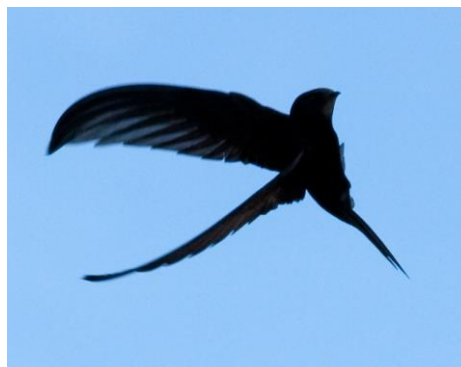
Un vencejo llegando a su nido