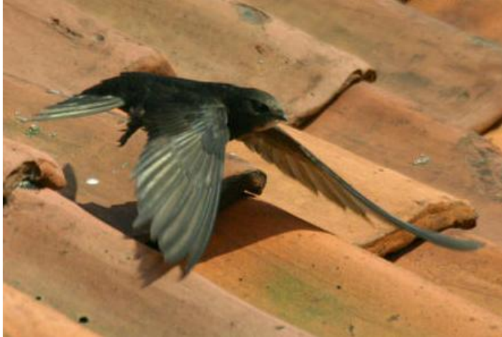
Un vencejo deja su nido debajo de tejas en Lincoln